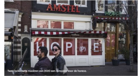
Twee lockdowns maakten van 2020 een rampjaar voor de horeca.

01 maart 2021 11:15 Aangepast: 01 maart 2021 11:31